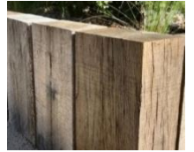
Traverses et clôtures