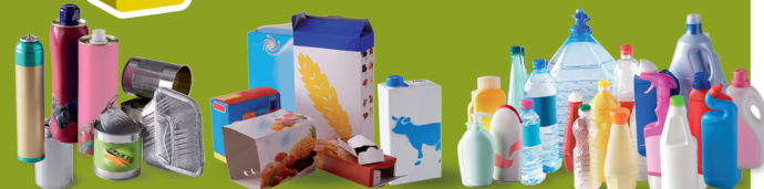
Boîtes et bouteilles métalliques • Cartonnettes et briques • Bouteilles et flacons plastiques